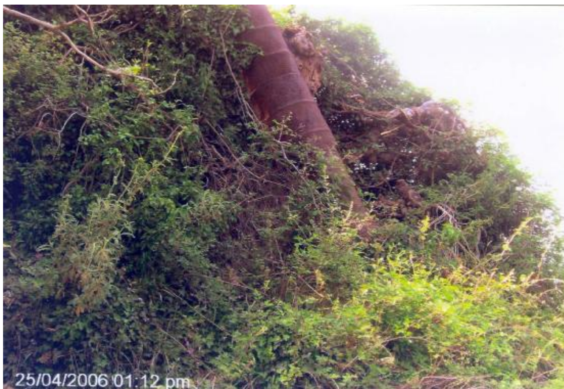
ΤΟ ΒΑΓΕΝΙ ΚΑΙ Η ΚΡΕΜΑΣΗ